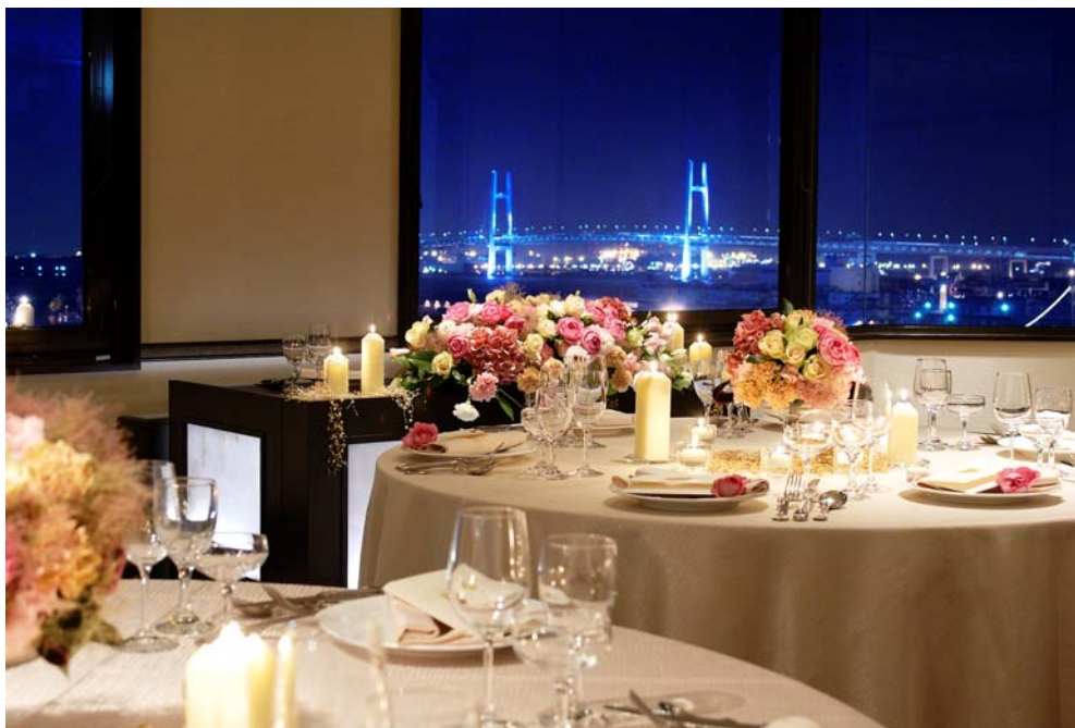
〈Fortunare-フォルトナーレー〉

今回新しくオープンした 100 名様まで収容のバンケット「Fortunare」では、ウエディングや2次会も承ります。昼の美しい景色は夜には輝きに満ちたイルミネーションへと変わり、昼とはまた違ったロマンチックな眺望を作り出します。眺望もゲストへのおもてなしの一つ、お客様の舌と心を魅了するウエディングを実現できます。きらめく景色とゲストの笑顔に囲まれた華やかなパーティー、過剰な演出には頼らないゲストの皆様への感謝とおもてなしの心を伝えるパーティーなど、お二人の佳き日を迎えるにあたってのご要望をかなえるための相談相手として、ウエディングプランナーがオリジナリティー溢れるご提案をさせていただきます。