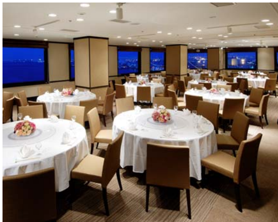
新バンケット<フォルトナーレ> (着席 100名様・立食 150名様まで)