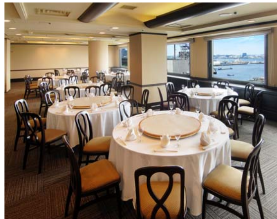
バンケット<アンバー> (20~70名様)